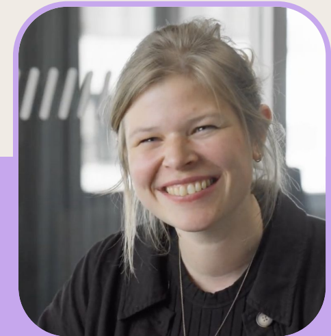
LENA Naturpark Westensee Obere Eider e.V.

„So viele inspirierende und motivierende Menschen waren dabei. Für dieses tolle Netzwerk, das man mit und durch die Akademie aufbauen konnte, bin ich richtig dankbar.“