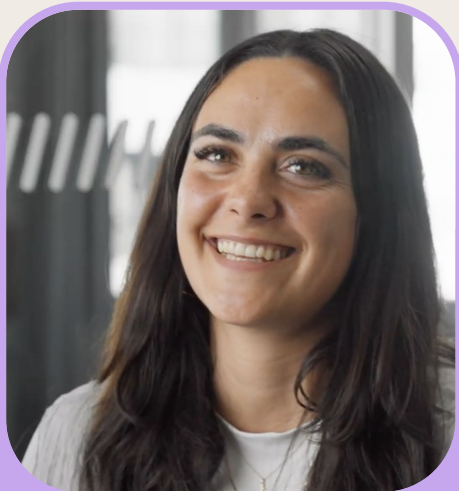
NAIMA Mitgründerin ROOTS Berlin

“Die CHANGEMAKER AKADEMIE hat mir geholfen, unbewusste Denk- und Verhaltensmuster zu erkennen und innere Ruhe zu finden – eine neue Klarheit, die ich gezielt in meiner Beratung einsetze.”